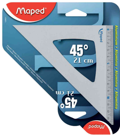
Equerre à dessin 45°