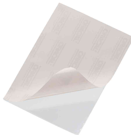
Pochettes autocollantes POCKETFIX®, recto