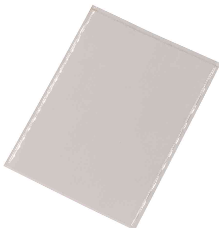
Pochettes autocollantes POCKETFIX®