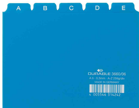
Leitregister A - Z, blau