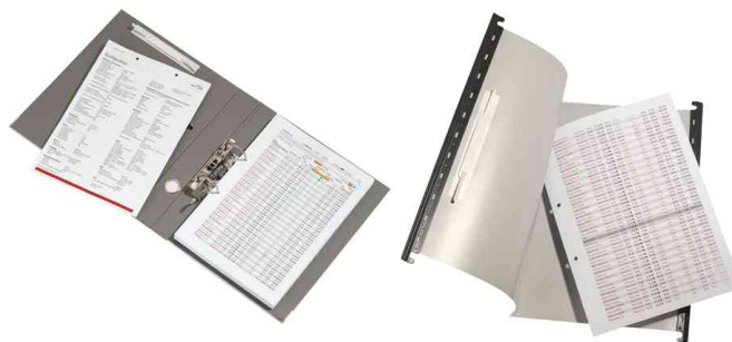
Exemple d'utilisation, Typ 1