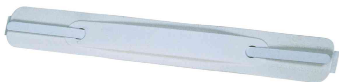
Attache flexi, autocollant Flexifix®, type 2