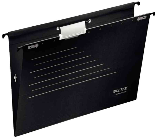
ALPHA Active Hängemappe, schwarz