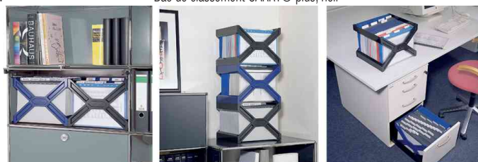
Bac de classement CARRY® plus, exemples d'utilisation