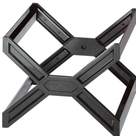
Bac de classement CARRY® plus, noir