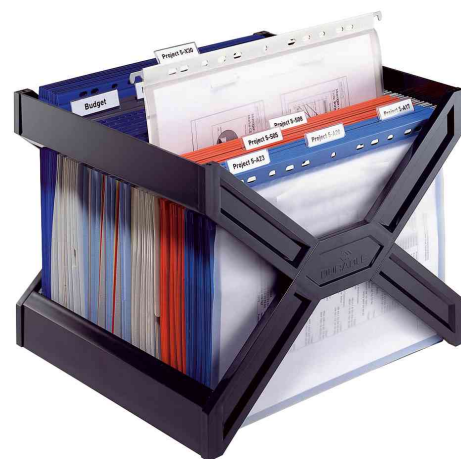
Bac de classement CARRY® plus, utilisation