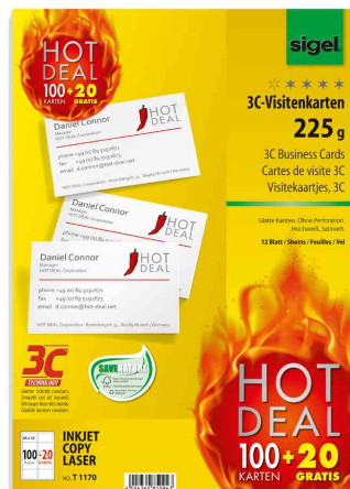
Cartes de visite 3C