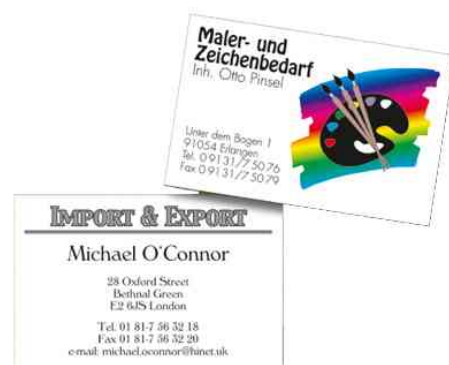
Cartes de visite 3C, exemple d'utilisation