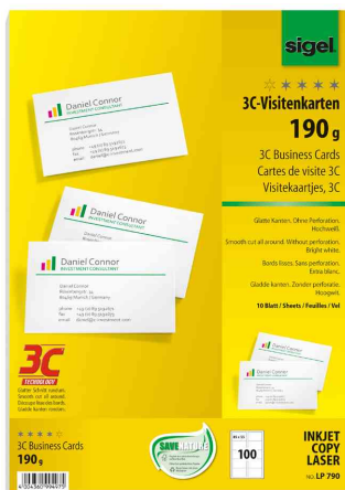
Cartes de visite 3C