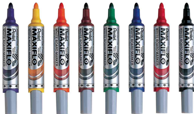
Marqueur pour tableau blanc MAXIFLO MWL5M

Pour effacer aussi les écritures faites avec les marqueurs permanents pour tableaux blancs: écrire dessus et effacer à sec