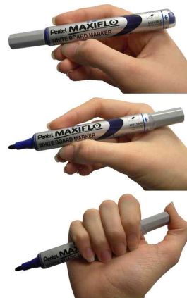
Bouton pressoir Maxiflo