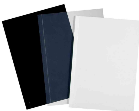
(2/4) Pochettes pour baguette à relier / Couverture