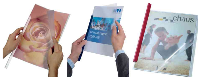
Baguettes à relier, exemple d'utilisation