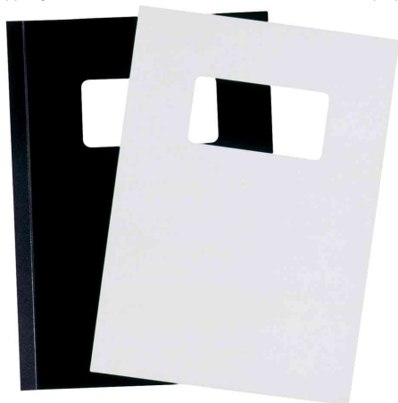
(4) couverture avec fenêtre