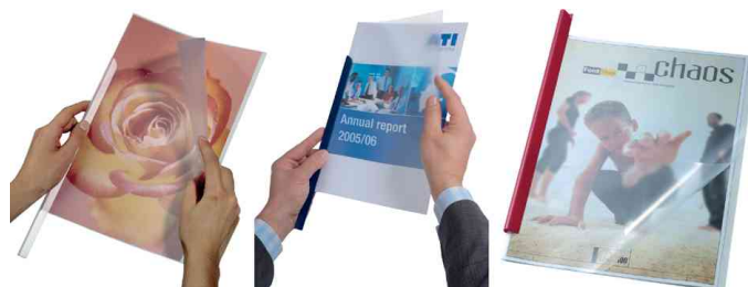
Baguettes à relier, exemple d'utilisation