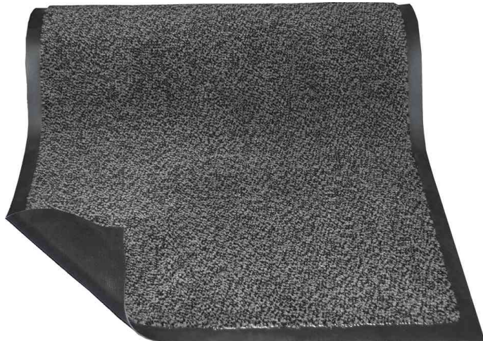
Tapis antipoussière en PP