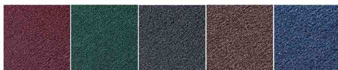
Bordeaux - vert - gris - marron - bleu