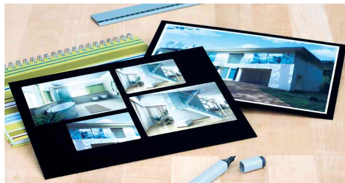
Etiquettes brillantes SPECIAL, utilisation