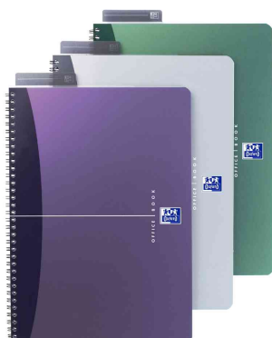
Cahier reliure à spirale - couverture en PP

• sans microperforation • couverture en polypropylène bicolore - flexible et très résistant • papier optique: 90 g/m 2 - très blanc, soyeux • avec une règle marque-page • une règle pour mesurer ou tracer des lignes • spirale double recouverte d'un plastique noir • couleur assortie • couleurs assorties, le choix d'une couleur spéciale n'est pas possible