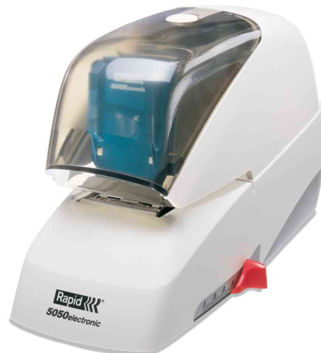
Agrafage électrique 5050e, blanc/noir