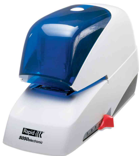
Agrafage électrique 5050e, blanc/bleu