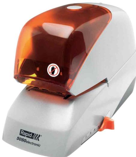
Agrafeuse électrique 5050e, argent/orange