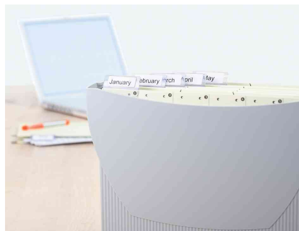
Étiquettes onglets SPECIAL, utilisation