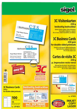
cartes de visite 3c, extra blanc, impression recto-verso

- offre de la place sur la surface arrière pour adresse, plan d'accès, heures d'ouvertures et etc