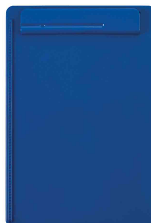
Porte-bloc OG uni