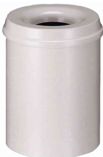
Corbeille à papier en acier, gris lumière