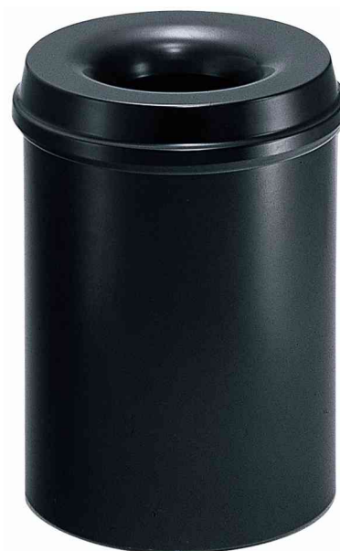
Corbeille à papier en acier, noir