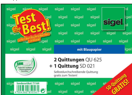
Formularbuch-Set "Test the Best"