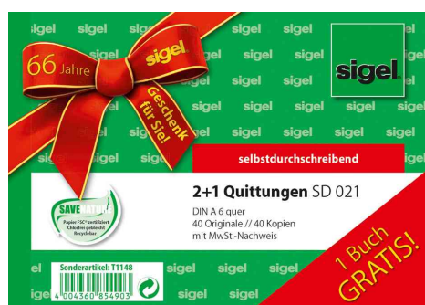
Quittung mit MwSt. "2+1 GRATIS Aktion"