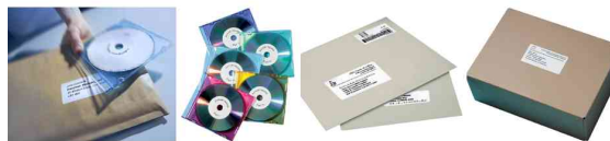
Exemples d'utilisation N:\VivalP\Koepef\16756\Anwendungen_LW400Twin.jpg