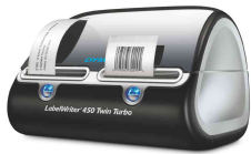
Imprimante d'étiquettes "LabelWriter 450 Twin Turbo" N:\VivalP\Koepef\16756\S0838870.jpg