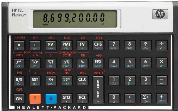
HP 12c Platinum