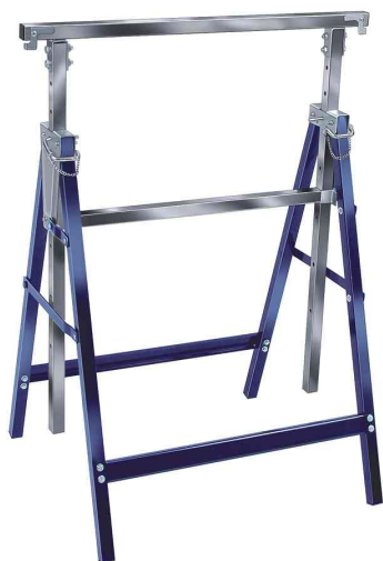
Tréteau de travail télescopique MB 160 H

• tube en acier solide et stable à section carrée • revêtement résistant aux chocs et aux rayures • repliable donc peu encombrant • réglage en hauteur grâce aux boulons d'arrêt de sécurité facile à utiliser • crochet rétractable pour éviter un glissement latéral du plan de travail (largeur maximale: 640 mm) • montage simple • couleur: bleu/argent • en pièces détachées dans un carton présentoir