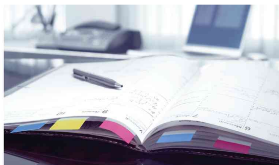
Post-it Index repositionnables, utilisation