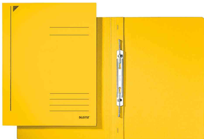
Chemise à spirale