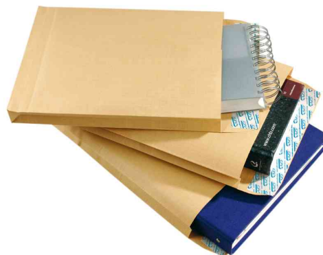
Pochettes à soufflet bande renforcée - exemple d'utilisation