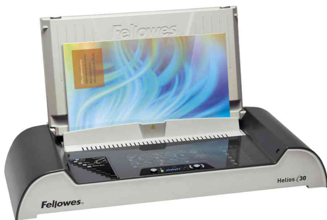
Thermorelieur Helios 30