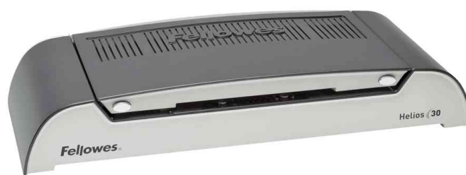
Thermorelieur Helios 30, fermé