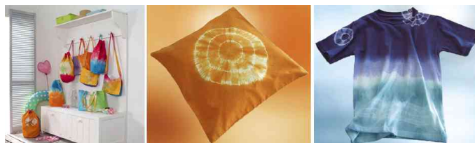
Couleur pour la teinture et le batik "Easy Color", utilisation