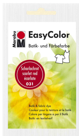
Couleur pour la teinture et le batik "Easy Color"