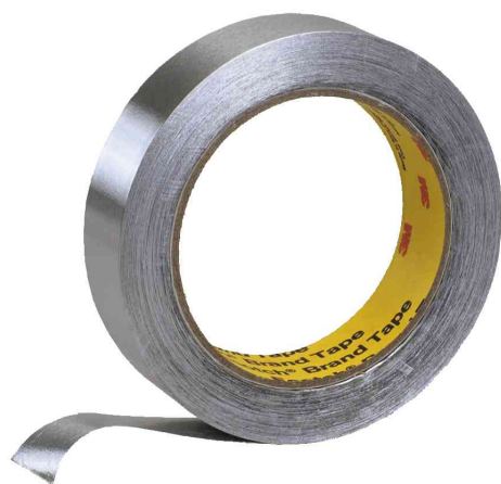
3M ruban adhésif en aluminium souple 1436F