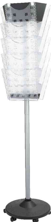
Porte brochure de sol, 15 emplacements