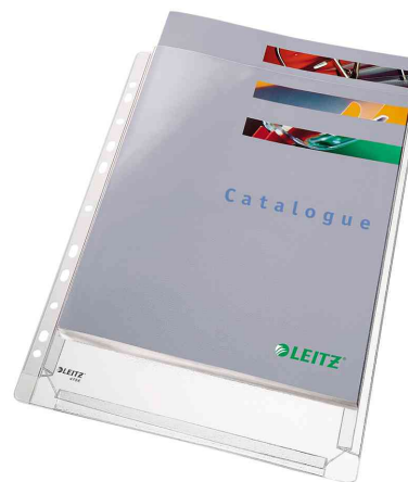
Pochette perforée maxi Standard, utilisation