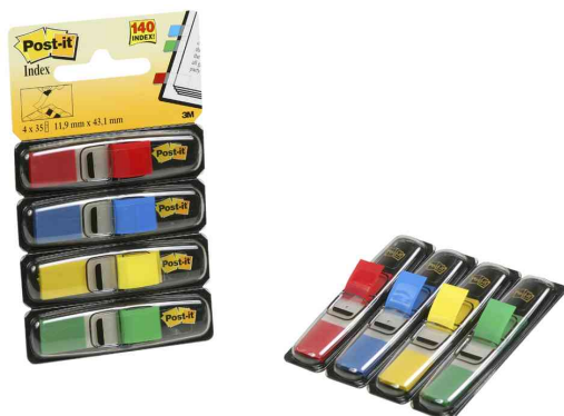
Post-it mini bandes adhésives index, dans un dévidoir design