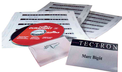
Kit de badges

- pour création rapide et professionnelle de badges