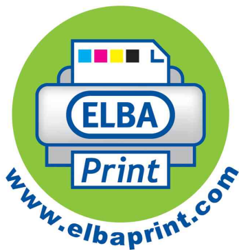
ELBAprint - créer des produits comme les professionnels

• format: A4 • en PP particulièrement résistant, 0,15 mm • couverture inscriptible, gris / blanc