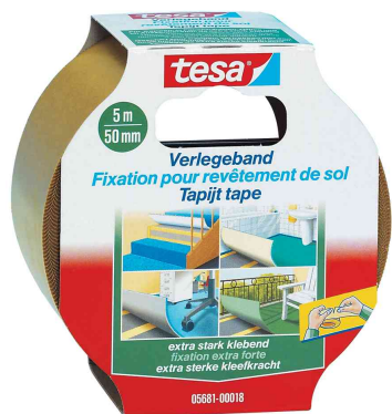
Fixation pour revêtement de sol