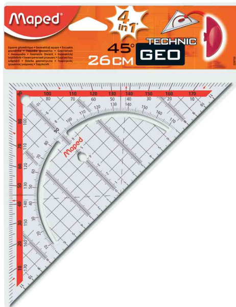
Equerre géométrique Technic, emballage sous blister