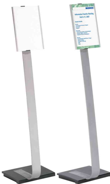
Support d'information INFO SIGN stand, format portrait