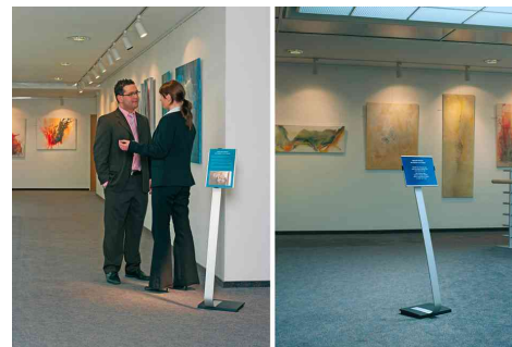
Support d'information INFO SIGN Stand, exemple d'utilisation