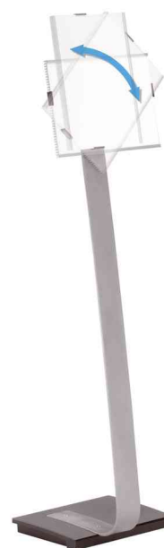
pivotement du format portrait au format paysage