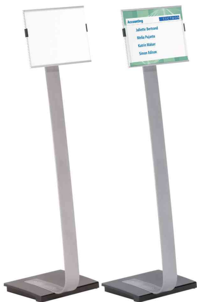
Support d'information INFO SIGN stand, format paysage