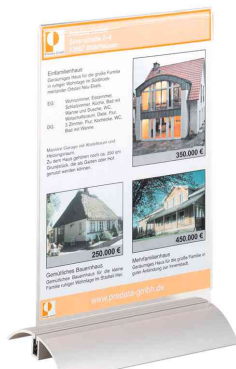
PRESENTER, format A5