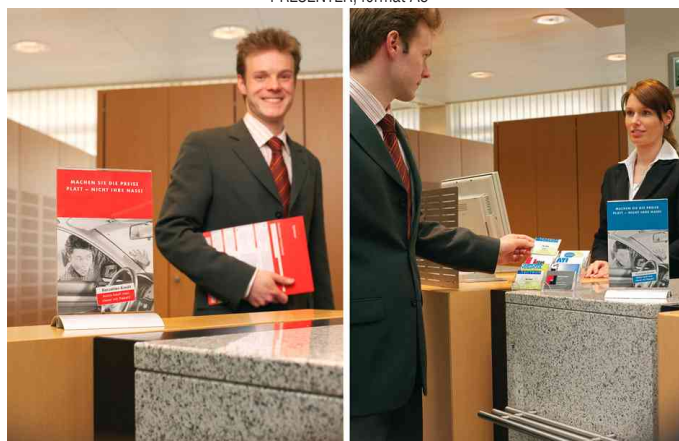
PRESENTER, exemple d'utilisation