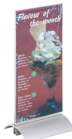
PRESENTER; format long