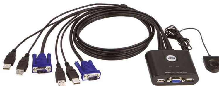
Commutateur KVM câblé, USB 2.0, 2 ports