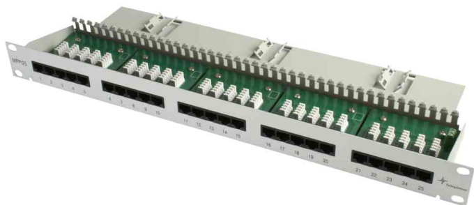
Panneau de brassage 19" RNIS avec gestion de brins

• sert au compartiment RNIS comme un pose des fils et aide classeur, à attacher directement aux bornes terminale (par ex. modem, fax) pour améliorer la surveillance de plusieurs installations de RNIS • les Patch Panels RNIS sont effectués comme des boîtiers tiroirs 19" 1 U et comportent 25, 30 respectivement 50 RJ45 de fiche femelle non blindée (8-positions / 4-contact) • ceux qui sont effectués comme LSA-Plus contact sont dénotés de (3, 4, 5, 6), pour garantir une encoche de câble de sécurité et sans problème • le câble serait grâce au connecteur de câble usuel (n' est pas contenu dans la livraison) • la connexion douille est numérotée sur le plastron; en outre le port d' identification peut être butiné sur l'appellation du champ complémentaire • le boîtier est fabriqué en tôle d'acier et laqué; version non blindé (tôle non couvert pour le connecteur de déplacement d' isolant) • livrable avec ou sans gestion de brins