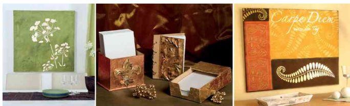
Feuilles de métal Home Design ART DECO, utilisation