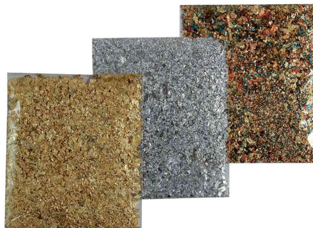
Flocons de métal Home Design ART DECO, or - argent - metallic-mix