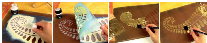
Feuilles de métal Home Design ART DECO, instruction pour réalisation de pochoirs