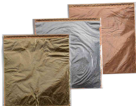
Feuilles de métal Home Design ART DECO, or - argent - cuivre