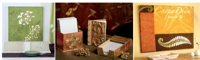
Feuilles de métal Home Design Art DECO, utilisation