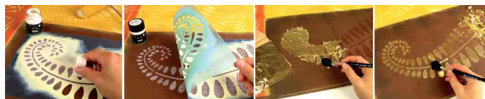
Feuilles de métal Home Design ART DECO, instruction pour réalisation de pochoirs