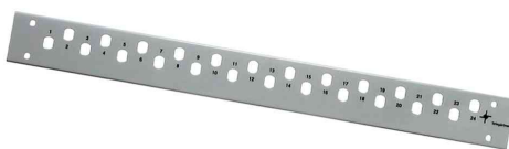
Plaque frontale pour panneau de brassage 1 U