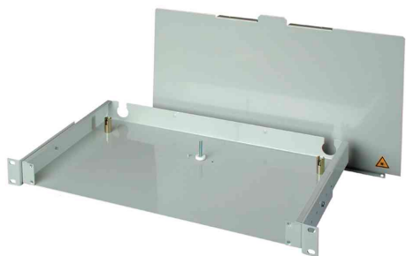
Panneau de brassage - Base V