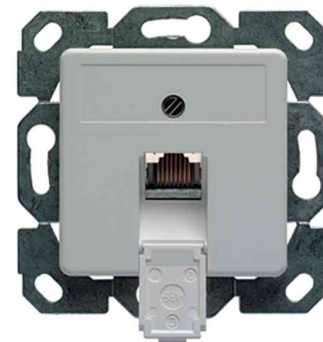
AMJ45 Anschlussdose, einfach