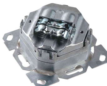
AMJ45 Anschlussdose Rückansicht