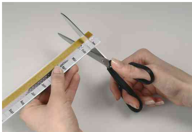
se découpe à la largeur désirée