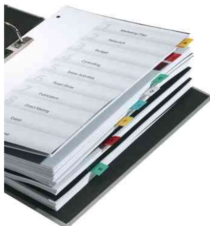
Onglets autocollants transparents TABFIX®, exemple d'utilisation