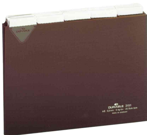
Leitregister, aus Kunststoff