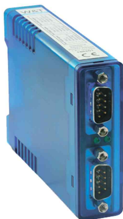
Isolant optique RS422-RS485 - 1 KV

• approprié pour les serveurs COM 24 Volt de W & T • 0 - 40 degrés de température ambiante • -40 +70 degrés en stockage • 1 x fiche Euro et 1 x fiche 2 broches pour bornes à vis • boîtier plastique en noir • dimensions: (L)26 x (P)175 x (H)532