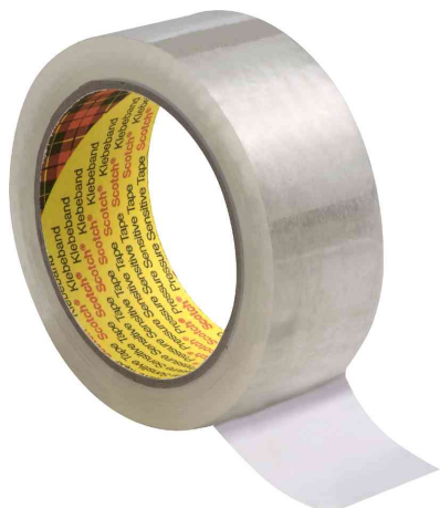
3M Adhésif d'emballage 305