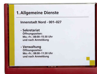
Plaques de porte Click Sign, format A5, rouge