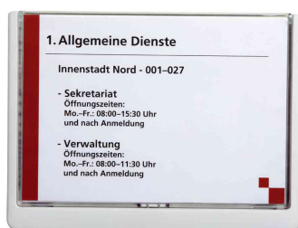
Plaques de porte Click Sign, format A5, blanc