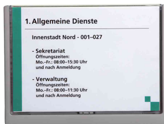
Plaques de porte Click Sign, format A5, graphite