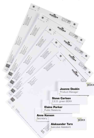
Accessoires: plaque de porte INFO SIGN REFILL