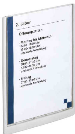
Plaques de porte Click Sign, format A4, blanc