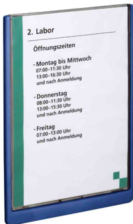
Plaques de porte Click Sign, format A4, bleu foncé