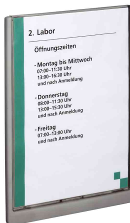
Plaques de porte Click Sign, format A4, graphite