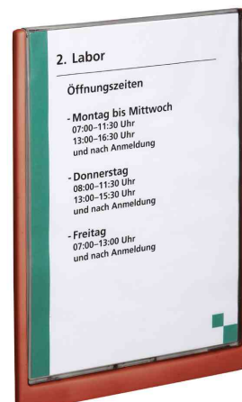
Plaques de porte Click Sign, format A4, rouge